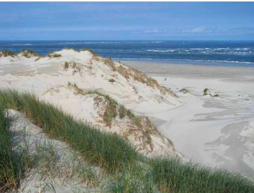
Spontane kerfontwikkeling op de Noordsvaarder Terschelling, 26 mei 2016.

In de handleiding leiden de auteurs de beheerder door het proces van voorbereiding, uitvoering en nazorg van een dynamiseringsproject. Uiteraard is het belangrijk om eerst uit te zoeken welke doelen passend zijn in het landschap. Bij een aangroeiende kust zijn andere mogelijkheden en beperkingen dan bij een afslagkust. En op de Waddeneilanden is er een andere overwegende windrichting op de Noordzeeduinen dan op de Hollandse kust. Ten zuiden van Bergen bevat het duinzand meer kalk dan in de duinen boven Bergen. Zo zijn er talloze factoren waarvan de beheerder zich goed moet realiseren welke relevant zijn voor een project. Plus natuurlijk de afweging tussen enerzijds soortenbehoud en anderzijds dynamiek. Plekken waar nu goed ontwikkelde grijze duinen voorkomen met