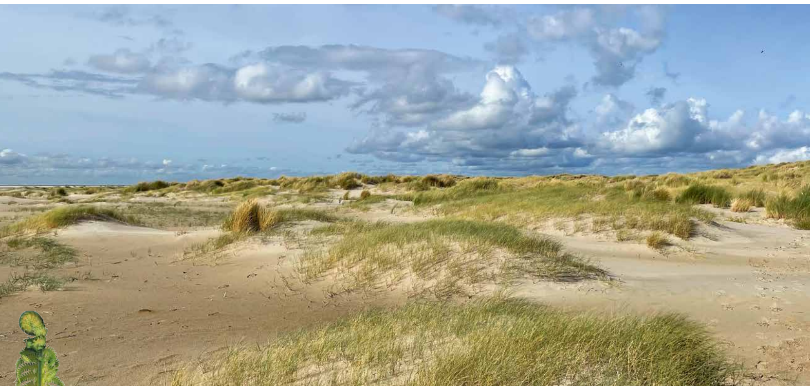
Duinenveld op de Hors, Texel.

Flora, fauna, drinkwater, landschap en veiligheid varen wel bij een dynamische kust