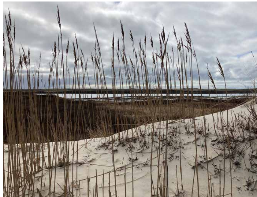
Riet op het duin, maart 2021, Terschelling paal 15-20.