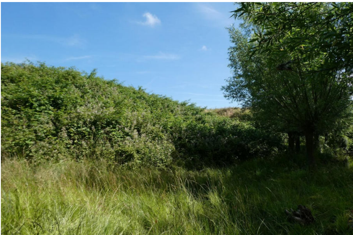
Figuur 10: Op de Wallen van Retranchement vormden de uitbreidende struwelen van dijkviltbraam in 2018 een bedreiging voor de waardevolle bloemdijkvegetatie

Waar dijkviltbraam dominant wordt, ontstaan de al meermaals ter sprake gekomen zeer soortenarme bramenkoepels. Volgens Ossig & Brandes (2019) verdringen uitbreidende braamstruwelen in het stedelijke gebied vrijwel alleen algemene soorten zoals grote brandnetel ( Urtica dioica ), glanshaver ( Arrhenatherum elatius ), zwenkdravik ( Anisantha sterilis ) en kleeftkruid ( Galium aparine ). In de beschikbare Nederlandse vegetatieopnamen van monodominante dijkviltbraamstruwelen zijn de genoemde soorten ook meermaals genoteerd in de ondergroei, maar doorgaans worden kruidachtige soorten slechts aangetroffen in de uiterste rand van de dichte dijkviltbraamstruwelen. In het centrum is door lichtgebrek nauwelijks of geen ruimte voor kruidachtige soorten. Buiten de ruderales