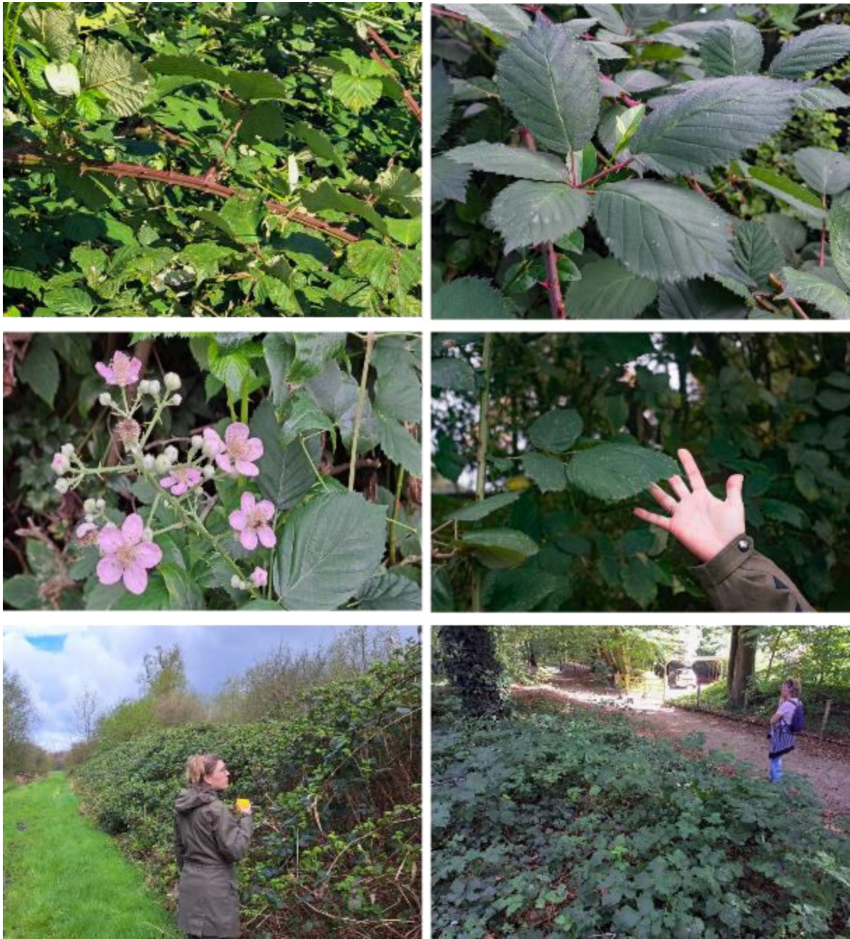
Figuur 4. Dijkviltbraam (Rubus armeniacus). Boven links: gegroefde, rode bladloot; boven rechts: bol blad; midden links: helder roze bloemen en een afstaand behaarde bloeiwijze; midden rechts: dijkviltbraam kan enorme bladeren vormen in de halfschaduw (zie ook de stekels met rode voet); onder links: in de volle zon en met voldoende ruimte vormt dijkviltbraam enorme, vrijstaand tot wel 3 meter hoge, soortenarme struwelen (Lelystad, Flevoland); onder rechts: op plaatsen waar de lichtomstandigheden minder optimaal zijn houdt dijkviltbraam wel stand, maar is de vegetatie veel minder dicht en hoog en is er ook ruimte voor andere, schaduwtolerante soorten (Bennekom, Gelderland).

In Zeeland kan verwarring ontstaan met koebraam ( Rubus ulmifolius , Fig. 5). Dit is landelijk gezien een zeldzame soort die zijn hoofdverspreiding heeft in Mediterraan-Atlantisch Europa en in Zeeland en Zuid-Limburg nog net ons land bereikt (rubus-nederland.nl). Evenals dijkviltbraam is koebraam een zeer forse plant die uitgebreide, soortenarme struwelen kan vormen, maar deze soort gedraagt