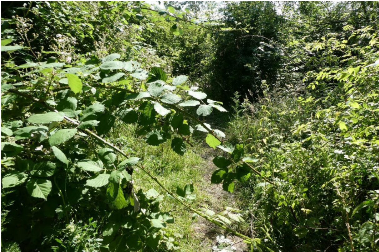
Figuur 9. Extensief beheer geeft dijkviltbraam de mogelijkheid om via de bladloten die aan de top wortelen snel uit te breiden en uitgestrekte, dichte struwelen te vormen. Voordat deze loten de grond raken dienen ze verwijderd te worden om dit te voorkomen (Wallen van Retranchement).

Door de grote zaadproductie en de vorming van vlezig vruchten die een aanpassing zijn aan langeafstandsverspreiding door zoogdieren en vogels, weet de soort relatief gemakkelijk nieuwe groeiplaatsen te bereiken. Anders dan andere bramensoorten kan deze soort ook periodiek onder water staan. Vooral waar open grond aanwezig is kan de soort zich zo vestigen, en dit verklaart het voorkomen in ruderaal en urbane omstandigheden, maar met het droogvallen van de platen in de afgesloten zeearmen is ook een enorm potentieel leefgebied voor deze soort ontstaan. Door de vorming van een zaadbank is de soort bovendien in staat op plekken met wisselende omstandigheden een gunstige periode af te wachten zonder op dat kritieke moment de plek nog te moeten bereiken.