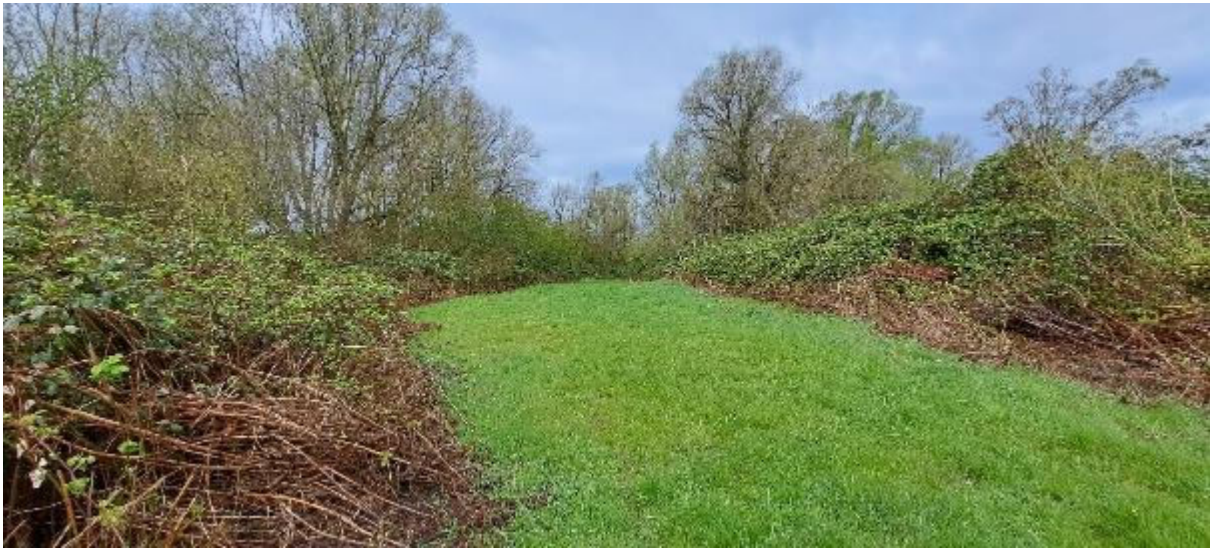
Figuur 1. In Laag-Nederland kan dijkviltbraam enorm uitgestrekte struwelen vormen, zoals hier in de rand van wilgenbossen in de Flevopolder. Naast problemen met de biodiversiteit kan de soort voor problemen zorgen voor de toegankelijkheid van terreinen, bijvoorbeeld doordat paden dichtgroeien.

met de belangrijkste praktische informatie. Tenslotte kijken we in hoofdstuk 5 wat dit rapport betekent voor andere gebieden dan het Zeeuwse.