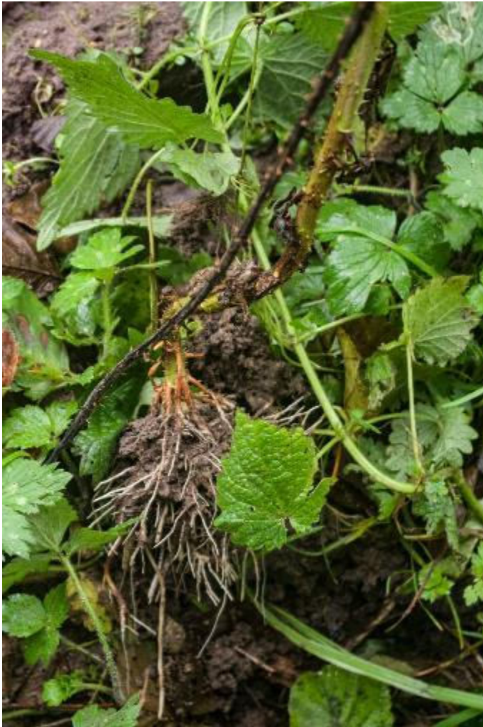
Figuur 3. Gewortelde top van 1 e jaars loot van dijkviltbraam. Harderwijk, 25-10-2023.

Het ecologische voordeel van een zaadbank is de korte responstijd in een omgeving waarin de omstandigheden over de jaren sterk wisselen: in gunstige periodes kan een soort zich meteen vestigen vanuit zaad en is zo niet afhankelijk van het onzekere dispersieproces om de locatie precies op het gunstige moment te bereiken. Aangezien een deel van de zaden altijd dicht bij de moederplant terecht komt kan er vanuit worden gegaan dat in de bodem onder volwassen, vruchtdragende planten van dijkviltbraam ook een zaadbank opgebouwd wordt van deze soort.