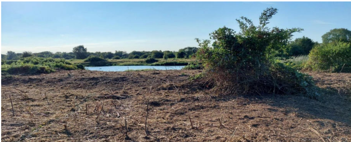
Figuur 13. Gemaaid dijkviltbraamstruweel op de Slikken van de Heen. Opvallend is de vrijwel onbegroeide situatie die achterblijft na het maaien, indicatie voor het ontbreken van een kruidlaag onder de braamstruwelen

Gezien de grote problemen die dijkviltbraam kan veroorzaken en de bijzonder moeizame bestrijding is vroegtijdige signalering en onmiddellijke bestrijding van de soort altijd nodig. Als de soort zich eenmaal op enige schaal gevestigd heeft wordt de bestrijding een zaak van lange adem en een dikke portemonnee. Een extra probleem daarbij is de verwarring die gemakkelijk optreedt met inheemse en deels (zeer) zeldzame bramensoorten. Bestrijding van dijkviltbraam mag niet ten koste gaan van de inheemse bramensoorten, maar dit vraagt in het geval van de bramen om bijzondere aandacht!