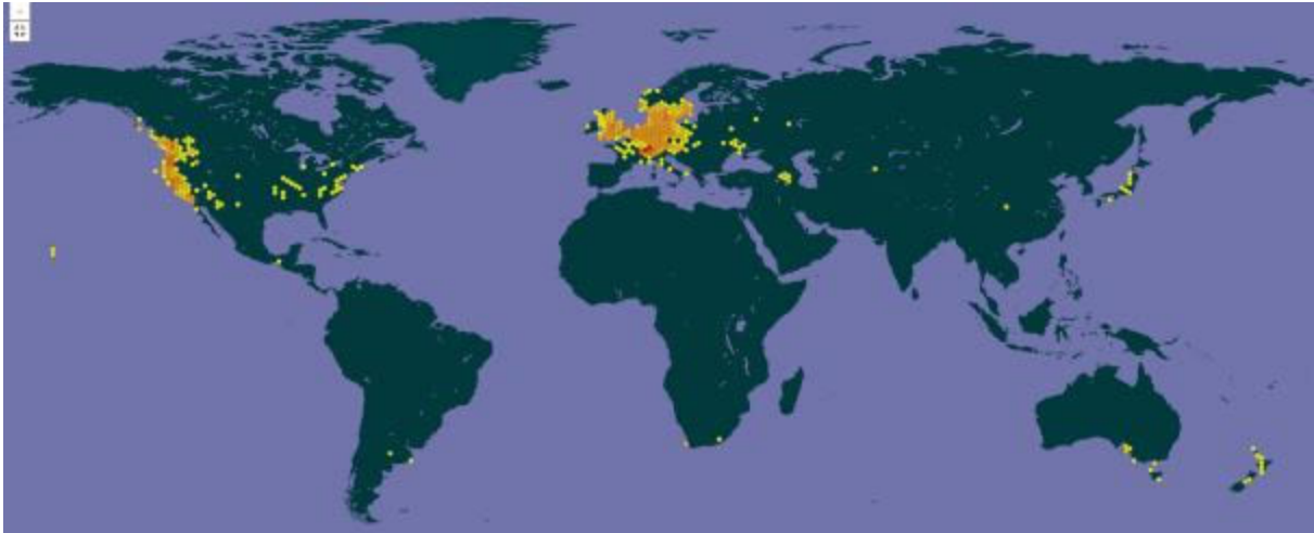
Figuur 6. Wereldwijde verspreiding van dijkviltbraam ( Rubus armeniacus ).