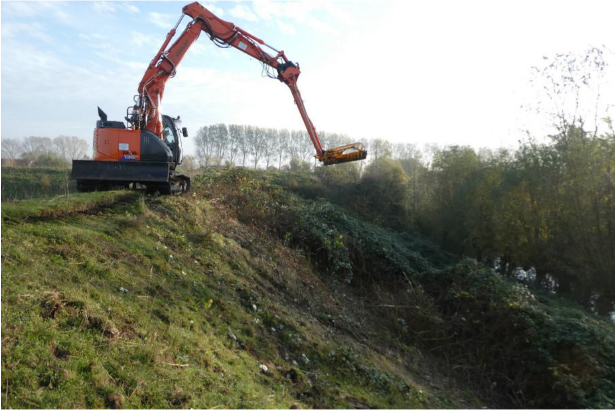
Figuur 11. Maaien van de grote dijkviltbraamstruwelen op de Wallen van Retranchement in 2018

Waar struwelen van dijkviltbraam worden getolereerd maar niet mogen uitbreiden, is onderhoudsbeheer nodig om te voorkomen dat ondergronds via wortelstokken, of (vooral) via wortelende bladloten uitbreiding plaatsvindt. Begrazing is hiervoor naar onze inschatting niet gecontroleerd genoeg en een maaibeheer is nodig om te voorkomen dat de toppen van de bladloten de grond bereiken. Dit zal ongeveer vanaf het begin van de bloei gecontroleerd moeten worden om tijdig in te kunnen grijpen. Een andere mogelijkheid is de randen van de struwelen elk jaar op tijd volledig terug te zetten, om de bladloten te verhinderen te wortelen in de omringende vegetatie. Maaien of anderszins korthouden van de omringende vegetatie is nodig om uitgroei en vestiging vanuit wortelopslag te verhinderen. Bij het maaien van bramen moet in het oog gehouden worden dat de hergroei in het jaar dat gemaaid wordt vaak het karakter heeft van de zijtakken van de plant, vooral als na de langste dag wordt gemaaid: ze zijn veel lager en slapper dan de oorspronkelijke stengels, en kruipen vaak zonder echte bogen te vormen. Hierdoor kunnen ze wellicht snel wortelen en zich zo alsnog uitbreiden. Bovendien zijn dergelijke laagblijvende loten lastig te maaien doordat ze over de bodem kruipen.