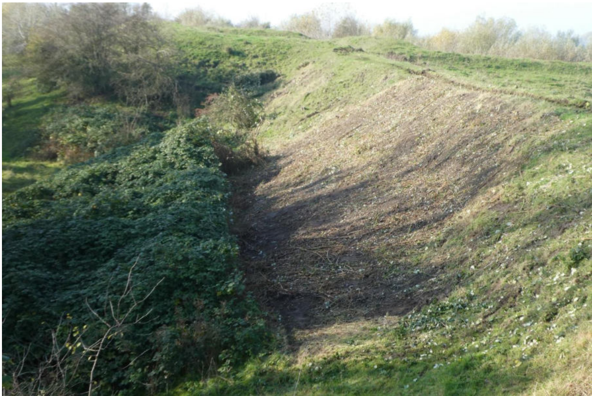
Figuur 12. Voorkomen is beter dan genezen: om een kaalslag als dit te voorkomen moeten bestaande struwelen in toom gehouden worden en dient een zorgvuldig graslandbeheer plaats te vinden

Het advies is om in elk geval sterk in te zetten op bestrijding of op zijn minst beteugeling van dijkviltbraam op bloemdijken en andere delen van het oude cultuurlandschap waar direct grenzend aan het struweel waardevolle lagere begroeiingen voorkomen. Hier zijn specifiek Zeeuwse natuurwaarden aanwezig die een uitloper vormen van de systemen langs de Franse en Vlaamse kust die verder in Nederland niet of nauwelijks voorkomen. Graslanden raken gemakkelijk in korte tijd overwoekerd door dijkviltbraam (zie de ervaringen bij Retranchement) en niet alle graslandsoorten die onder het struweel verdwijnen zullen gemakkelijk terugkeren nadat het struweel uiteindelijk is gerooid. Om zijdelingse uitbreiding van dijkviltbraam te voorkomen dienen loten die de grond (dreigen te) raken vroegtijdig (uiterlijk in september en wellicht nog een aanvullend later moment bij warm weer) ingekort te worden. Nieuwe vestiging van dijkviltbraam in deze graslanden moet zo vroeg mogelijk verwijderd worden, het liefst in het eerste jaar. Jonge planten kunnen in zijn geheel verwijderd worden en dit vraagt de minste inspanning. Bestrijding van te grote struwelen kan het beste plaatsvinden door te maaien. Dit dient in een zo vroeg mogelijk stadium (en minstens 2x, liever 3-4x per jaar) plaats te vinden, maar doorgaans is een meerjarige aanpak nodig om een gevestigd struweel kwijt te raken.