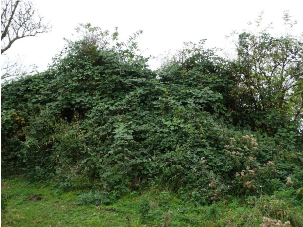
Figuur 8. Door zijn groeikracht kan dijkviltbraam andere struiken overgroeien en verstikken, zoals hier gewone vlier op de Slikken van de Heen

Dijkviltbraam is weinig kieskeurig ten aanzien van de bodem, hoewel het goed gedraineerde bodems met een goede vochtvoorziening prefereert. Volgens Caplan & Yeakley (2006) heeft de soort in het noordwesten van de VS een voorkeur voor relatief skeletrijke, weinig silt of klei bevattende bodems, wat wellicht voor een deel de voorkeur van de soort voor ruderaal-urbane milieus verklaart (Ossig & Brandes 2019). Hierbij moet echter aangetekend worden dat dijkviltbraam in Nederland, maar ook in de Pacific North-West van de VS (Caplan & Yeakley 2006) ook prima op kleiige bodems groeit. De zuurgraad op de standplaatsen bevindt zich in het zwak-zure tot neutrale traject (pH 5 – 6,5; Caplan & Yeakley 2006), maar in Nederland lijkt de soort ook op bodems met een hogere pH te kunnen groeien.