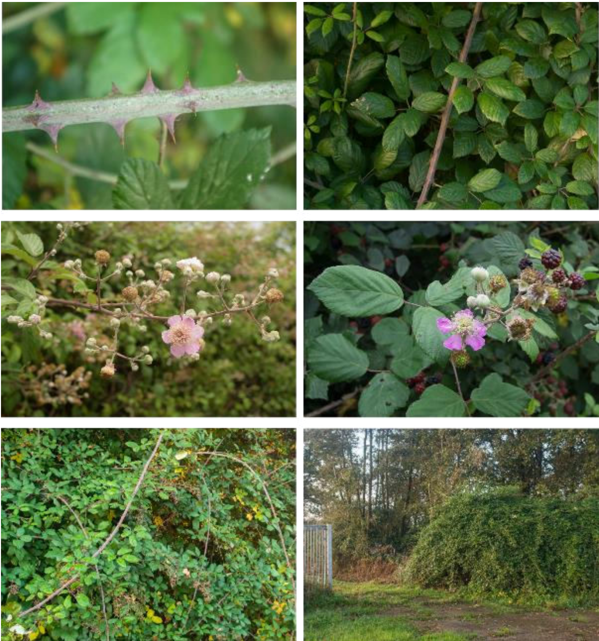
Figuur 5. Koebraam (Rubus ulmifolius). Boven links: berijpte bladloot met paars-rode stekels; boven rechts: relatief kleine, smalle blaadjes op een forse bladloot; midden: "blozende" bloemen die variabel wit tot dieproze zijn, op de rechter foto ook de relatief kleine vruchten; onder links: door de kleine blaadjes vallen de bladloten in een struweel veel meer op dan bij de dijkviltbraam; onder rechts: struweel in rand van bos rond een visvijver in de Betuwe.

zich niet invasief, wat wellicht veroorzaakt wordt doordat Nederland aan de grens van het areaal van deze soort ligt. In Zeeland komt deze soort voor in diverse landschappen en hier lijkt ze helemaal niet kieskeurig ten aanzien van zijn standplaats: de soort komt zowel voor in duinstruweel als op dijken, in heggen en andere perceelscheidingen (Dieleman 1970; Haveman & Van Haperen 2008; Klazenga 1990; Sýkora & Sýkora-Hendriks 1977; Van Haperen 2009). Koebraam is zeer variabel, wat komt doordat de soort zich niet apomictisch, maar zich 'normaal', seksueel voortplant. Toch is hij niet heel