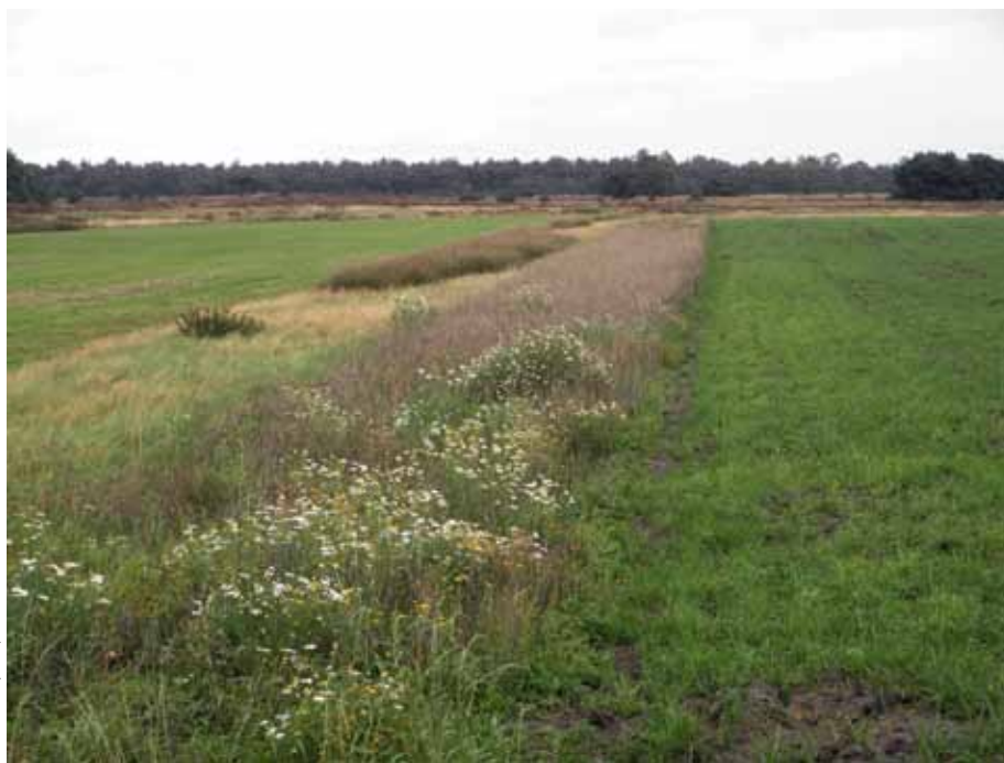
Figuur 6. Strabrechtse heide. Extensieve akkerbouw als onderdeel van het heidelandschap.

keuterontginningen en kampjes, of voormalige rijke heide die nu nog onder naaldbos ligt. In deze zone liggen de beste kansen voor gradienten met heischraal grasland en rijke droge heide. Te zwaar bemeste landbouwgrond kan door uitmijningsbeheer verschaald of lokaal ondiep geplagd worden zodat wel voldoende P achterblijft. Rijkere bodems onder naaldbos kunnen oppervlakkig verzuurd zijn. Lokaal plaggen in combinatie met bekalking levert hier de meeste winst op: het brengt het rijkere moedermateriaal aan maaiveld en maakt verzuring ongedaan. Aldus wordt ook de voedselkwaliteit voor de fauna hersteld en niet alleen ten aanzien van struikheide. In dergelijke rijkere (herstelde) systemen kunnen ook plantensoorten van heischrale graslanden met hoge bedekking voorkomen. Veel van deze soorten zijn van levensbelang voor fauna van heideterreinen (denk aan waardplantfunctie voor dagvlinders,