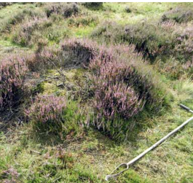
Figuur 5. Aftakelende struikheipol met een ring van vegetatieve verjonging door afleggende stengels.