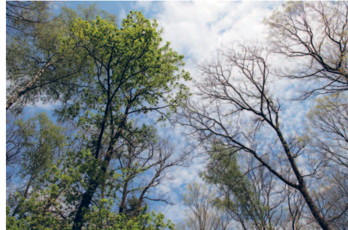
Figuur 4 In opstanden waar Amerikaanse eiken en zomereiken gemengd voorkomen, worden de Amerikaanse eiken (rechts) in een rupsenrijk jaar wel kaal gegeten, terwijl de zomereiken (links) worden gemeden en volop in blad staan. (foto: Arnold van den Burg).

Hoewel niet alle delen van het voedselweb in gelijke mate zijn aangetast, is de verarming van de karakteristieke fauna van heide- en bosgebieden als gevolg van N-depositie groot. Resultaten van recente studies geven duidelijk aan dat de fauna van het droog zandlandschap niet alleen reageert op aspecten als habitatstructuur, vegetatiesamenstelling en aanwezigheid van een droog en warm microklimaat, maar ook op veranderingen in nu-