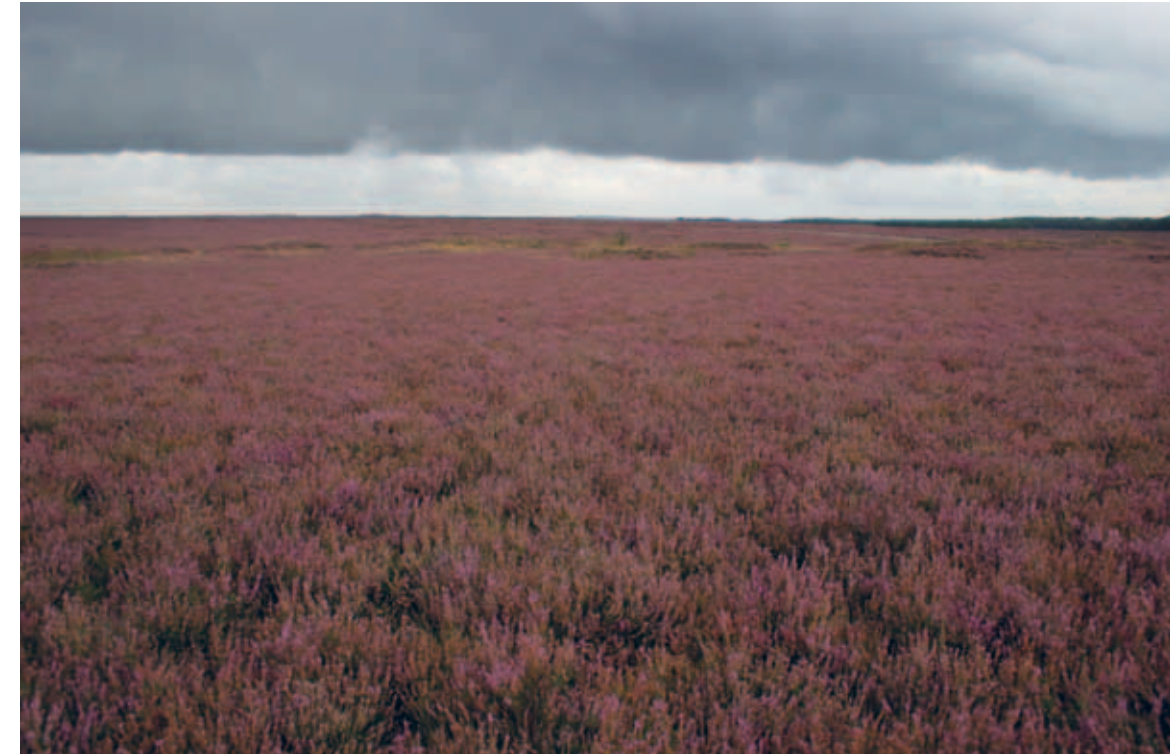
Figuur 1 intensief vegetatiebeheer leidt tot een landschap dat gedomineerd wordt door struikheide ( Calluna vulgaris ), maar ook tot een landschap dat arm is aan fauna.

Ook verzuring van de bodem leidt tot een verminderde voedselkwaliteit van planten (Vogels et al., 2011; Vogels, 2013; Vogels et al., 2013b). De hoeveelheid P in de plant wordt niet alleen bepaald door voor de plant beschikbaar P in de bodem, maar ook door de bufferstatus van de bodem. Op sterk zure bodems is de N/P-ratio van de vegetatie beduidend hoger dan onder meer gebufferde omstandigheden. Onder zure omstandigheden wordt P vastgelegd in, voor planten moeilijk af te breken, ijzer- en aluminiumverbindingen (Blume et al., 2016). Antropogene bodemverzuring heeft dus bijgedragen aan een afname van de P-beschikbaarheid (en die van andere